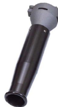
Lança de Espuma Modelo 214