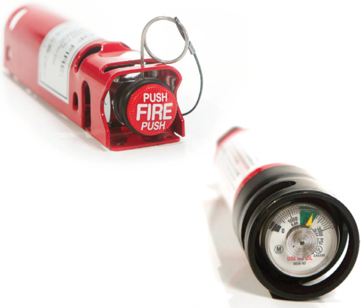
Cilindro de nitrogênio e detalhe do manômetro.

O cilindro de nitrogênio fornecido pela ARGUS é dotado de um manômetro, que permite a identificação do nível de pressão no interior do mesmo, eliminando a necessidade de pesagem, por ocasião das inspeções periódicas recomendadas por norma.