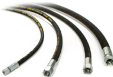
Mangueiras de distribuição