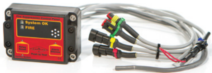
Painel de controle