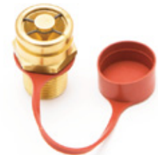
CAP do difusor