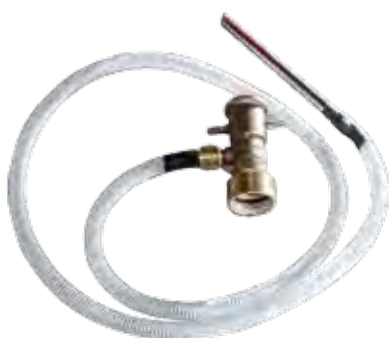
Esguicho Autoedutor Modelo SE

Esguicho autoedutor para montagem no canhão do caminhão pipa, esguichos manuais aerados (de baixa e média expansão), proporcionador de linha portátil e o Líquido Gerador de Espuma Amerex Classe A .