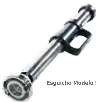
Esguicho Modelo S