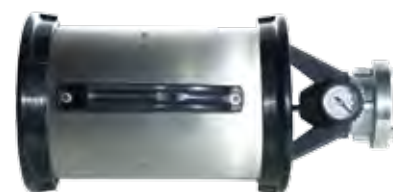
Esguicho Modelo M