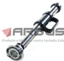
ESGUICHO MODELO S